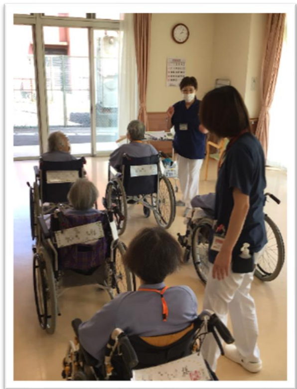
看護師が見守る中で経過観察を行っています